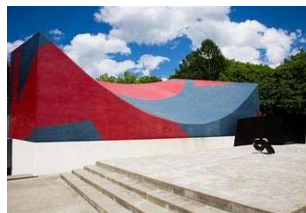
中村キース・ヘリング美術館