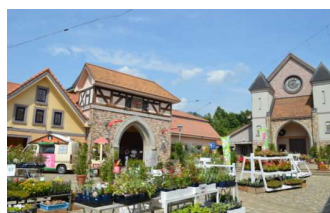
山梨県立フラワーセンターハイジの村