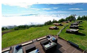
サンメドウズ清里スキー場