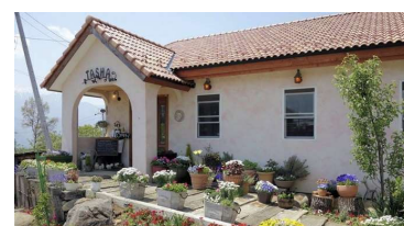
暖炉&ファームレストラン ターシャ