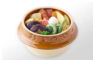
峠の釜めしおぎのや