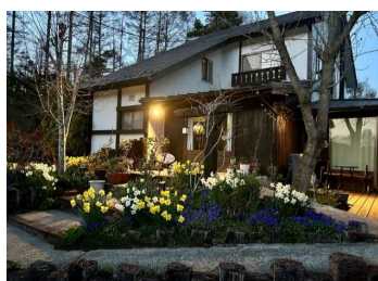
ライフクオリティ・カーザ