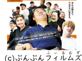
ふん ふん ふう りん む ず