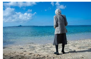
おおにしのぶお えぬびーおーほうじん こ こい ま

えいが あと おおにしのぶおかんたく ※映画の後、大西暢夫監督の とーく トークがあります。