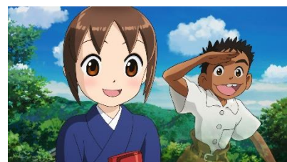
(c)令丈ヒロ子・亜沙美・講談社/ 若おかみは小学生！製作委員会